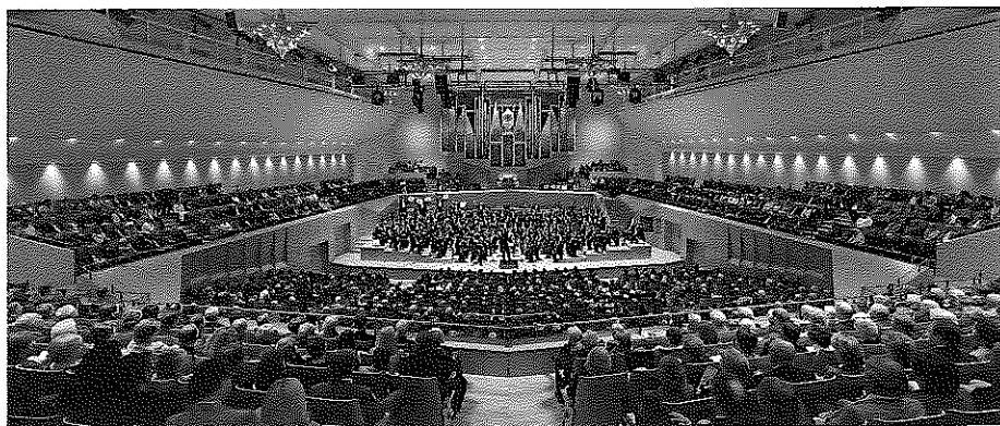
DEUTSCHLAND • 4. Wettbewerb für Auswahlorchester im November 2010 in Bamberg