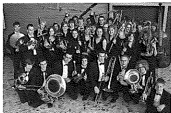
DEUTSCHLAND • Bläserjugend im BDB